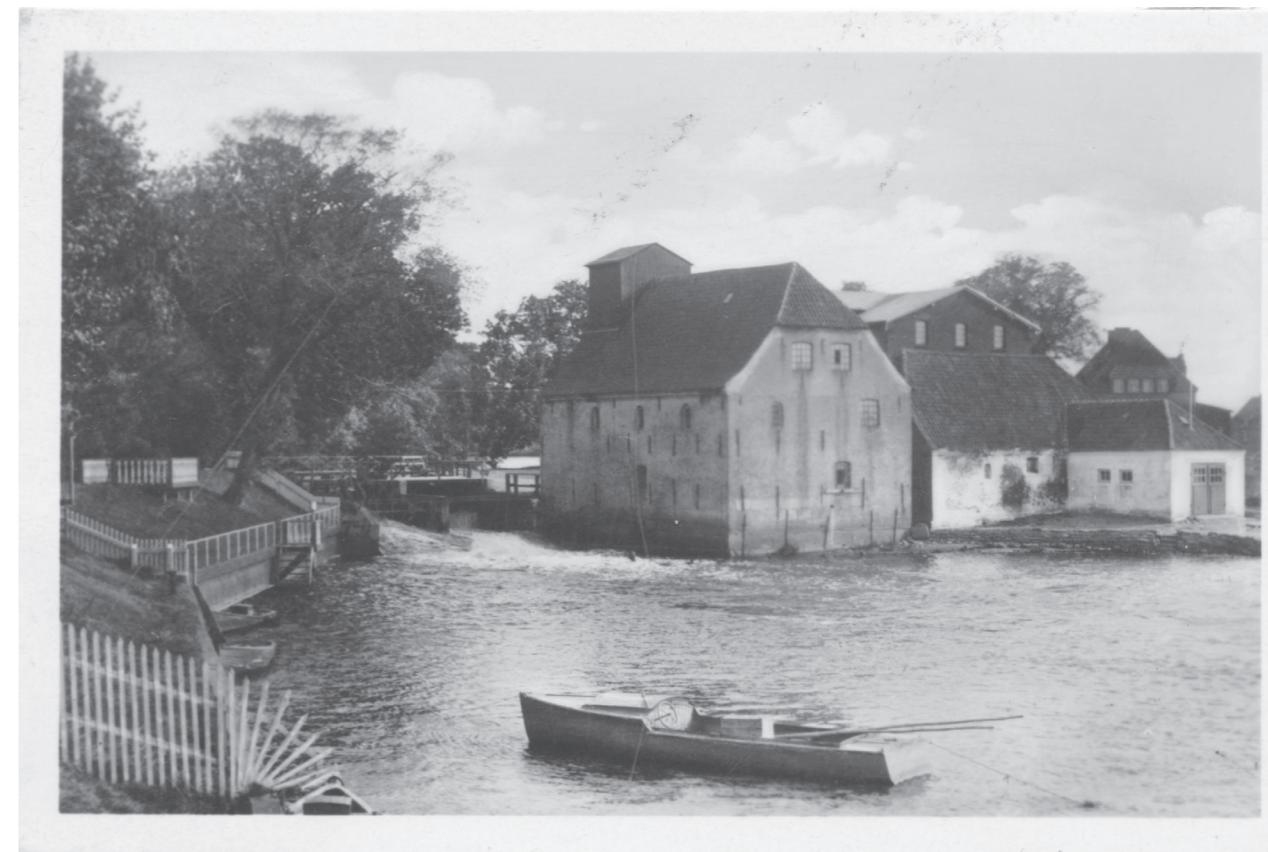
Familien Bachmanns mølle fra 1598 med pakhus fotograferet omkring 1930.