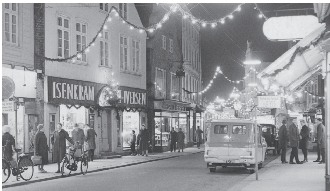
Juleudsmykningen i Vestergade i december 1964.